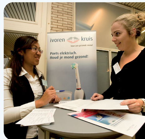
Beurzen zijn dé ontmoetingsplek voor contacten met de professie

Het Ivoren Kruis was ook in 2008 en 2009 actief op tandheelkundige beurzen en congressen. Dit zijn dé ontmoetingsplekken voor contacten met de professie om te werken aan de verbetering van de mondgezondheid en aan preventie. Hieraan werd onder andere gewerkt bij de Dental Union Open Huis Dagen, de NVT-, NVM- en NVvK/VBTGG-congressen en natuurlijk tijdens het eigen seminar 'Zin en onzin van preventie'. Alleen al tijdens de Henry Schein Open Huis Dagen werden dertig tandartsen en mondhygiënist lid van het Ivoren Kruis.