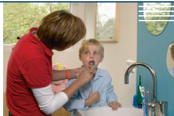
Gerichte preventieprogramma's bedoeld voor ouders van jonge kinderen (0-4 jaar) en oudere jeugd is nog steeds hard nodig

Het Ivoren Kruis onderzoekt samen met het Nationaal Instituut Gezondheidsbevordering en Ziektepreventie (NIGZ) de mogelijkheden om collectieve preventie te stimuleren. Daarbij wordt aansluiting gezocht bij de NMT, GGD Nederland en het RIVM (Rijks Instituut voor Volksgezondheid en Milieuhygiëne). Het NIGZ voert programma's uit op het terrein van collectieve preventie. Zij richt zich in het bijzonder op de jeugdgezondheidszorg, het onderwijs en verpleeghuizen.